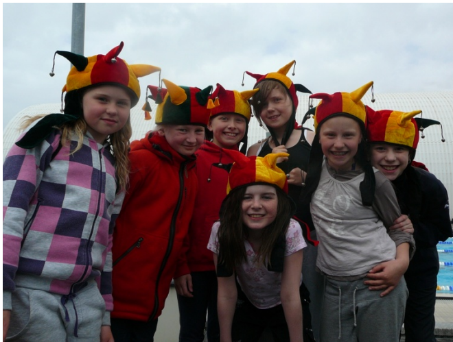
Hressir krakkar á ÍA leikum