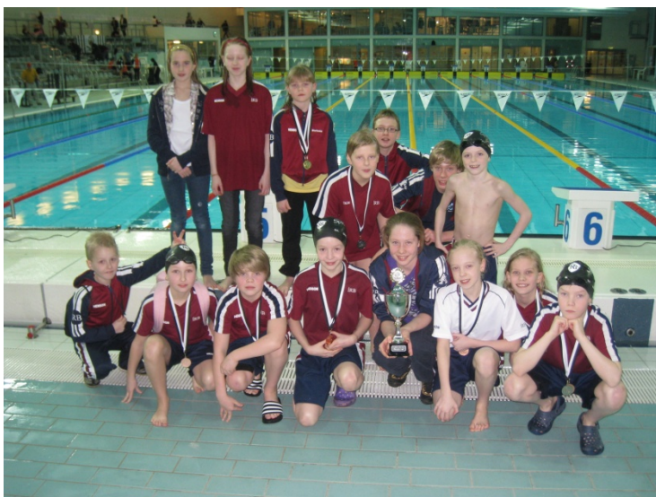
Sigur á Gullmóti KR