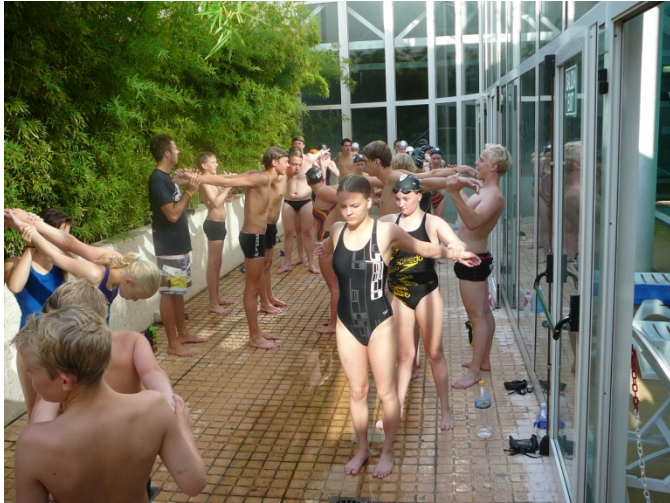
Teygt eftir erfiða æfingu á Benidorm