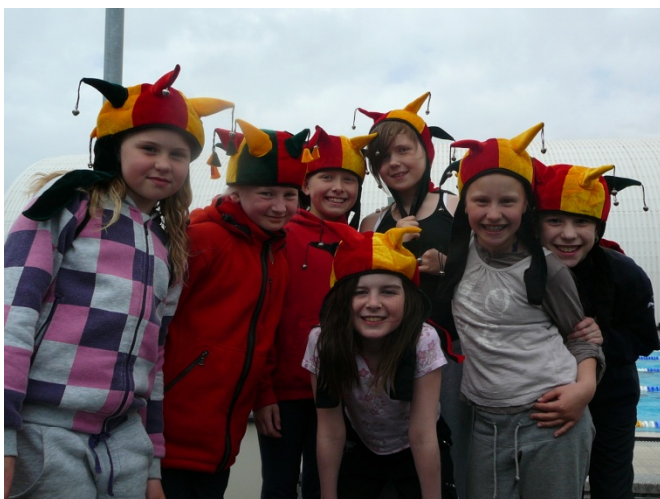
Hressir krakkar á ÍA leikum