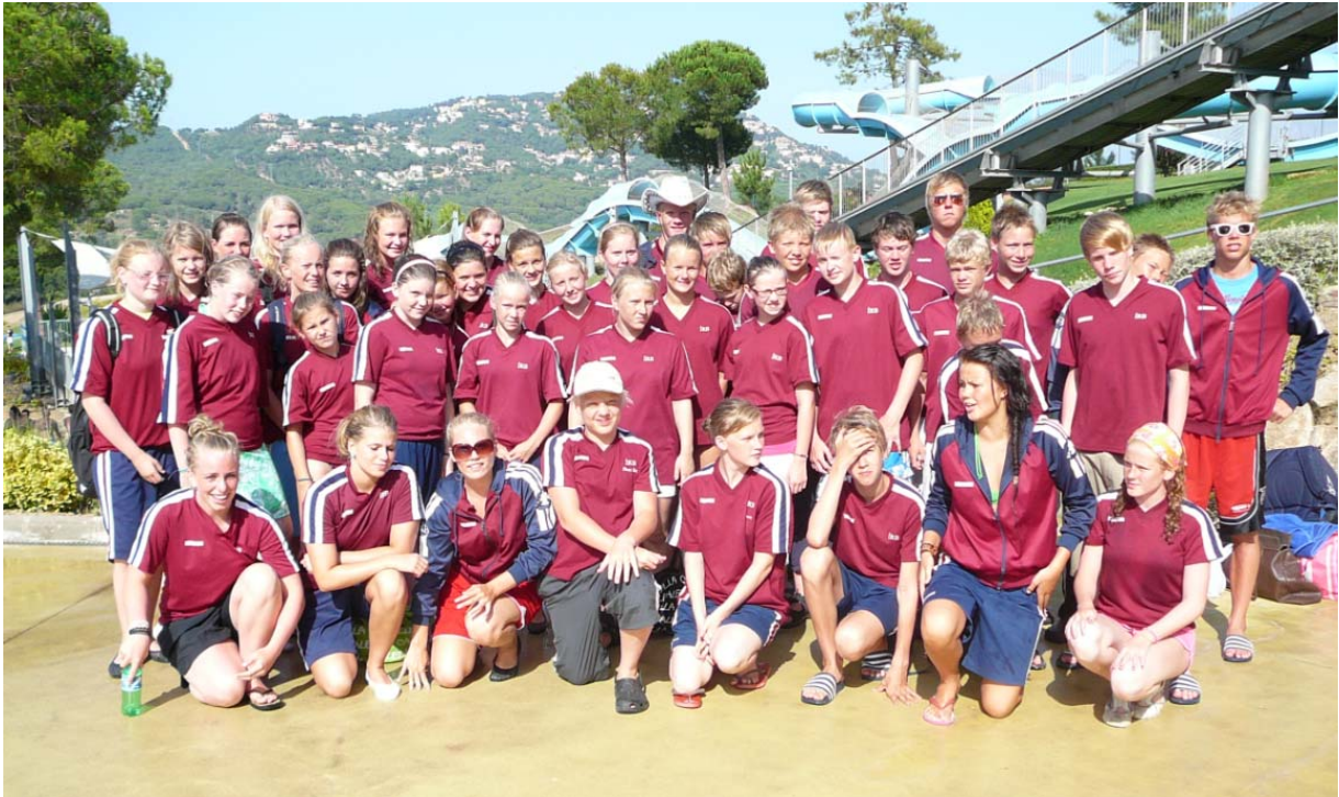
Calella – sundmennirnir