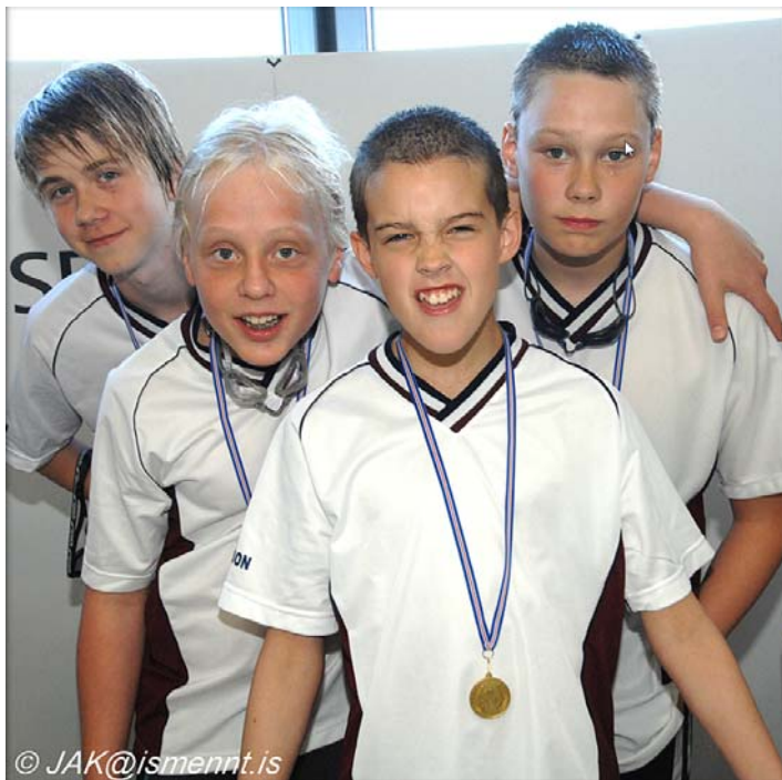
Sigursælar boðsundsveitir meylla og sveina á AMÍ 2008