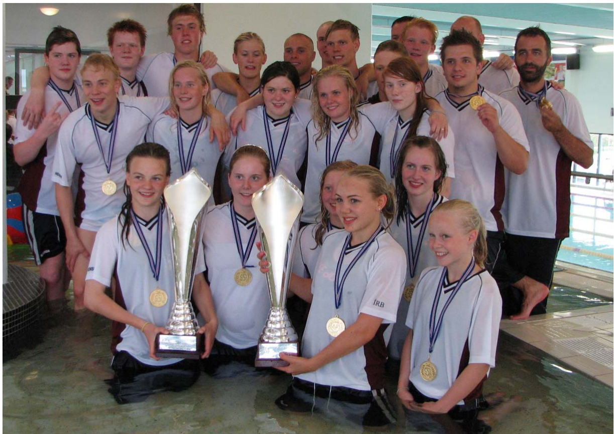
ÍRB – Bikarmeistarar karla og kvenna 2008